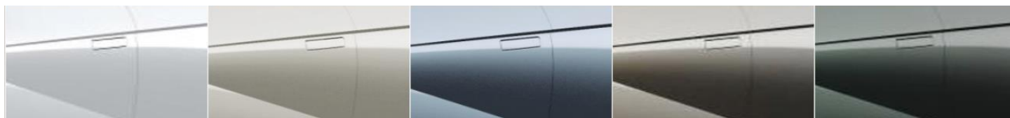
Naujiena „Atlas White“ balta