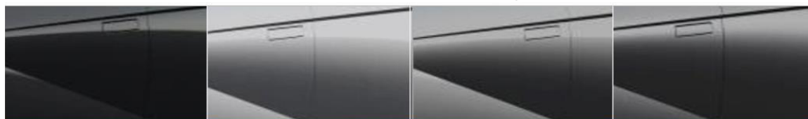
„Phantom Black“ juoda perlamutrinė (NKA)