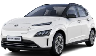
Serenity White - perlamutriniai / Phantom Black - juoda –stogas (W6E)