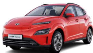
Engine Red (JHR) - Ypatinga spalva