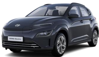
Dark Knight (YG7) - perlamutriniai