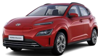
Sunset Red (WR6) - perlamutriniai