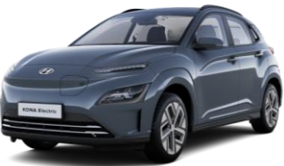
Dark Teal (TG8) - metalizuoti