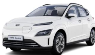
Atlas White (SAW) - lygi spalva