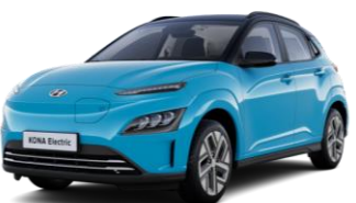
Dive In Jeju / Phantom Black - juoda –stogas (UT1)