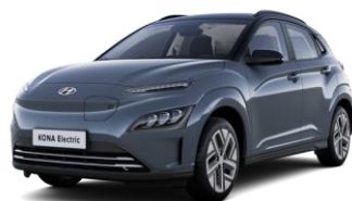
Dark Teal - metalizuoti / Phantom Black - juoda –stogas (TG1)