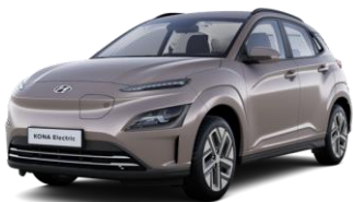
Silky Bronze (B6S) - metalizuoti