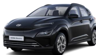
Phantom Black (PAE) – perlamutriniai