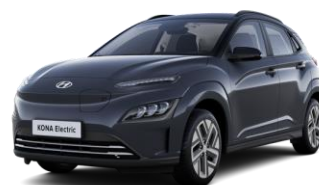
Dark Knight Gray - perlamutriniai / Phantom Black - juoda –stogas (YG1)