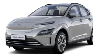
Shimmering Silver (R2T) - perlamutriniai