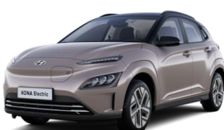
Silky Bronze - metalizuoti / Phantom Black - juoda –stogas (B6A)