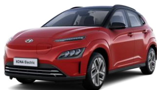
Sunset Red - perlamutriniai / Phantom Black - juoda –stogas (WRT)