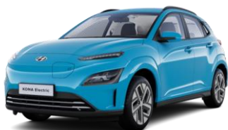
Dive In Jeju (UTK) – nemokama spalva