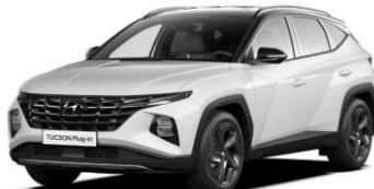
"Serenity White" perlamutrinė "Phantom Black" - juodas stogas (W6E)