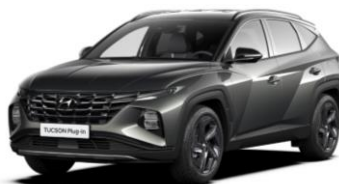
"Amazon Gray" - metalizuota "Phantom Black" - juodas stogas (A51)