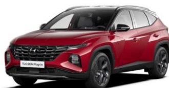
"Sunset Red" - metalizuota "Phantom Black" - juodas stogas (WRT)