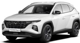
"Atlas White" (SAW)