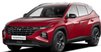
"Sunset Red" (WR6) perlamutrinė