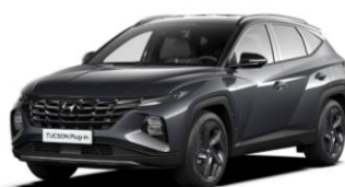
"Dark Knight" (YG7) perlamutrinė