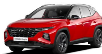
"Engine Red" (JHR) ** "Phantom Black" - juodas stogas