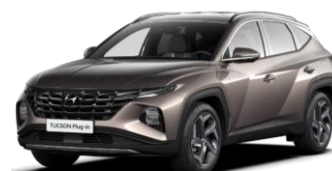
"Silky Bronze" (B6S)*