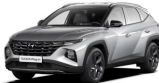
"Shimmering Silver" (R2T) metalizuota