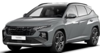
"Shadow Gray" (TKG) Speciali spalva (N Line)