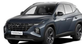
"Teal" (TG8)* metalizuota