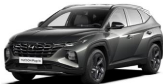
"Amazon Gray" (A5G)* metalizuota